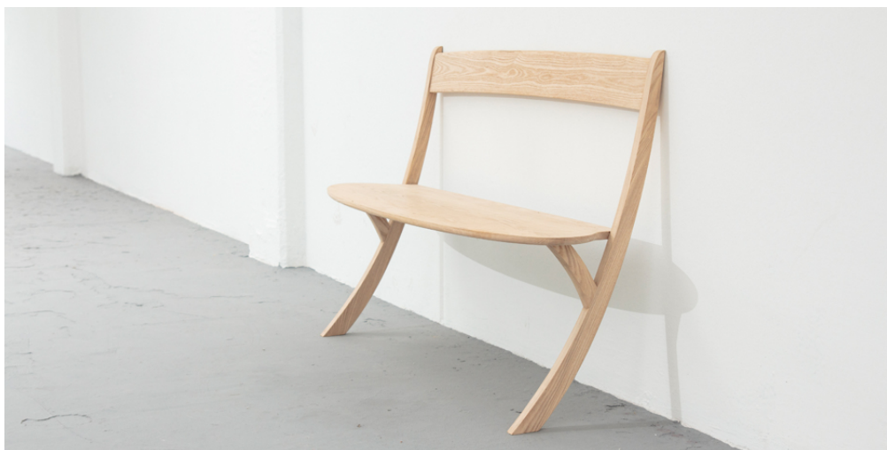
Leaning Bench by Izabela Boloz

With her latest design Leaning Bench, Izabela Boloz dares to question existing forms, proving that sometimes two legs will do just fine. It's all down to balance. By simply leaning the bench back against the wall elegantly, the design creates sufficient stability, while playfully challenging gravity. The result is a surprising and engaging object with a fluid simplicity, uncluttered by extra supports. Less really is more in this case.